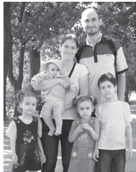
Идем дорогим читателям газеты «Новая жизнь»?

Помните песню Высоцкого, в котором постоянно звучит вопрос «Иметь или не иметь»? Любое, особенно хорошее дело, часто оказывается нелёгким и требующим вложений, но правильно сделанное и благословенное Богом радует добрыми плодами. Так и дети - больше забот, но значительно больше и радости. Особенно когда семья живет с Богом, возлагая заботы на Него, забот становится меньше, а радость Он умножает многократно!